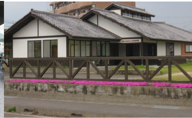
土地改良区事務所・串間市福島地区土地改良資料館