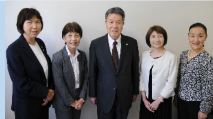
理事長、監事、3人の理事

豊川総合用水土地改良区(愛知県) 面積/ 15,055.9ha、組合員/ 22,603人 理事/ 理事19人(うち女性員外3人)