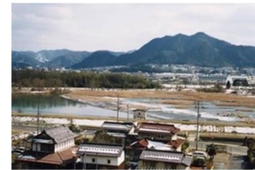
地域の農業を支える歴史ある栗用水