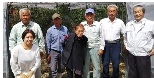
写真後列左から、堤副理事長、木本理事、古賀理事長、香月理事 写真前列左から、福地事務局員、中嶋理事、古賀事務局長