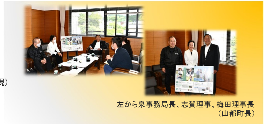
左から泉事務局長、志賀理事、梅田理事長(山都町長)