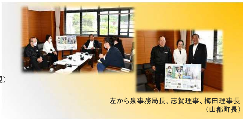
左から泉事務局長、志賀理事、梅田理事長 (山都町長)