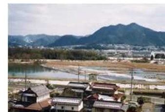
地域の農業を支える歴史ある栗用水