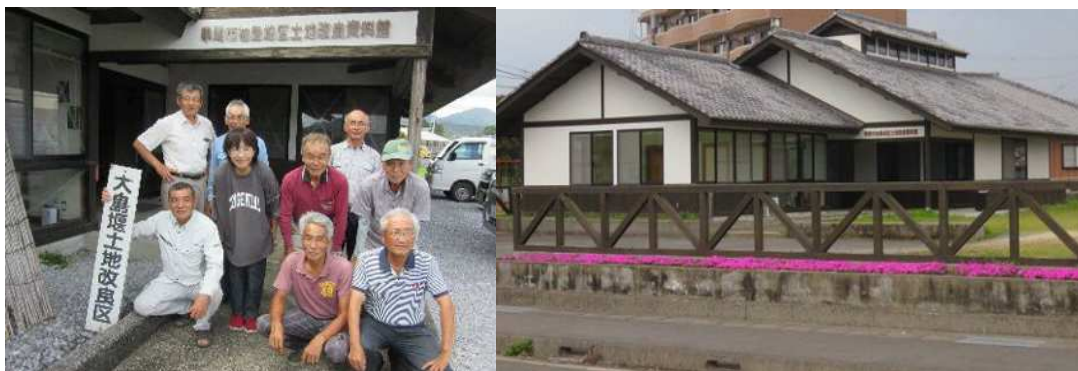
土地改良区事務所・串間市福島地区土地改良資料館

平成 7年6月 総代に選任 平成15年4月 理事に就任 平成23年4月 副理事長に就任 令和元年4月 理事長に就任