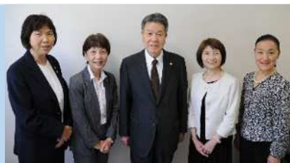
理事長、監事、3人の理事

豊川総合用水土地改良区(愛知県) 面積/ 15,055.9ha、組合員/ 22,603人 理事/ 理事19人(うち女性員外3人)