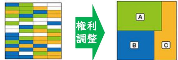
区画の整理にあわせて、換地と権利関係の調整を一体的に行うことで、担い手への農地の集積・集約化が実現