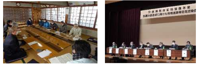
昨年度、現場で意見交換等を行った様子(島根県出雲市)