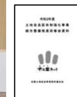
←実務で役に立つ研修テキストを作成

その他にも、災害が発生した地域への技術者派遣の調整や、農業農村整備事業の普及啓発活動、制度に対する建議等、変化する時代を見据え柔軟に対応し、ここに記載の内容に限らず幅広く活動を展開しています。